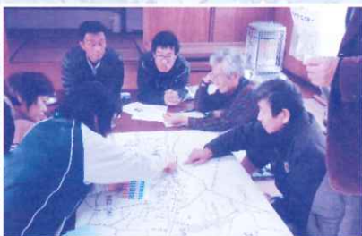
12月4日 上池田町内会