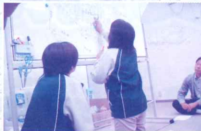
10月25日 美しが丘町内会