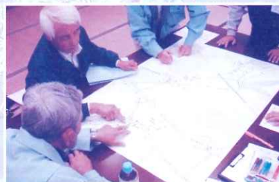
10月21日 大蒲生田町内会