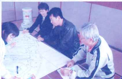
11月21日 五十嵐町内会