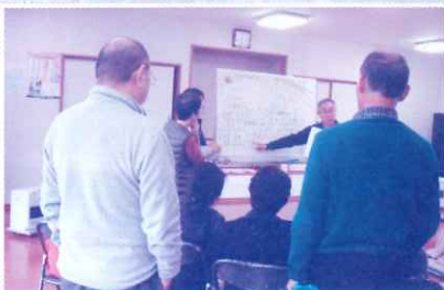
12月14日 望ヶ丘町内会