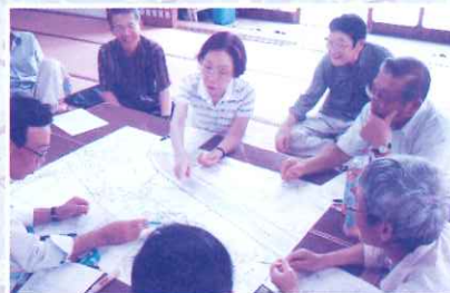
9月25日 下三分一町内会

急速な高齢化や核家族化の進行と家族機能の変化、地域の結びつきや人間関係の希薄化などで、地域の中で孤立する方が増えています。「支え合いマップ」は住民の生活のつながりや実態を住宅地図に載せていくことで、地域の支え合いの意識を高め、住みよいまちづくりを目指します。今回、支え合いマップづくりに取組んでみたいとお考えの町内会の皆さん、ぜひ、上越市社会福祉協議会頸城支所までご連絡ください。皆さんの町内会へ説明に伺います。