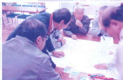
10月28日 西福島三区町内会