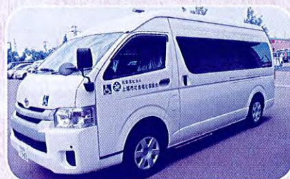
くびきの里デイサービスセンター