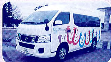
デイサービスセンターはながさの里