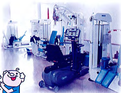
器械7台設置してあります