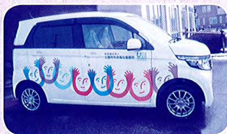
ヘルパーステーション上越北