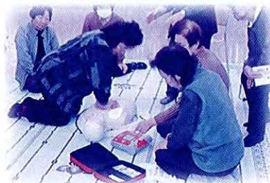
H27.2.25 開催の研修会の様子

地域でボランティア活動をしている方や、興味や関心をお持ちの皆さんを対象に研修会を行います。