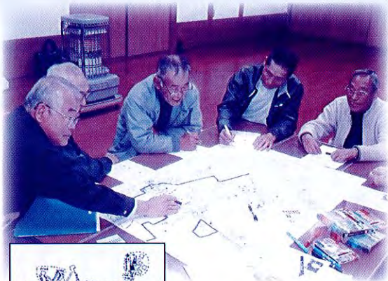
H26.11.19 日根津町内会の作成風景

説明にお伺いいたしますので、各町内会でふれあい支えあいマップをつくってみませんか。お気軽にご相談ください。