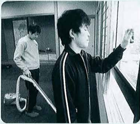
「水澤家」様での職場実習の様子