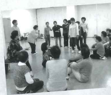
歌に ゲームに 動いて笑って レクリエーションの“技”を 教えていただきました!

9月26日(火)～11月14日(火)の間、全5回にてサロンボランティア研修会を開催しました。 「サロン」ってどんな活動?というところから、明日から使えるサロンネタの紹介・体験など… 楽しく学び思いのつながる良い時間となりました。