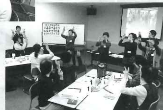
細く長い活動を 続けるためにも 「健康」が一番◎