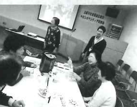
「ちょっと聞いてみよう! お隣のサロン」 先輩方のお話はとっても 参考になります!