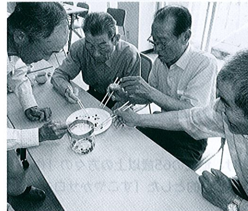
器用な男性陣のチームワークは下稲田の自慢です

まずは身近な隣近所での繋がりを深めることが大切と考えます。まだ一部ですが、隣組のお茶飲み会の開催を始めました。