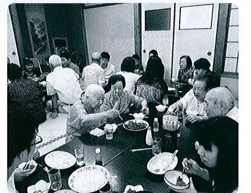
夏休みジュニア&シニア交流会 夏野菜カレー美味しかったよ