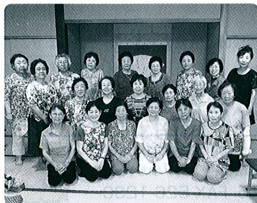
交流を通して「健康増進」・「やりがい発見」