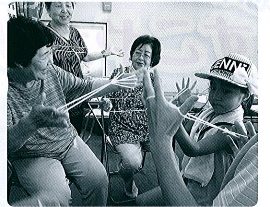
「できたよ」ご近所先生とほうきづくりに挑戦