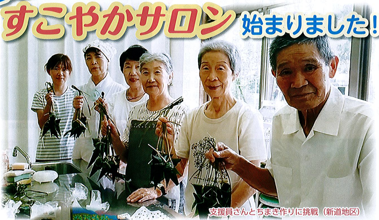
支援員さんとちまき作りに挑戦 (新道地区)