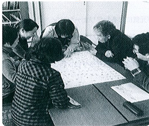
とっさの対応に役立てたい