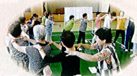
平成26年度サロンボランティア研修会

下記の通り、サロンボランティア研修会を計画いたしました。 住み慣れた地域で人と人がつながり、さらに豊かになるための 道標として、住民流地域福祉の推進にお役立てください。