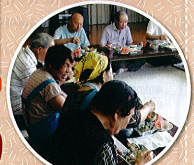
ふれあい昼食会(昭和町1丁目)