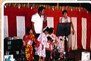
西松野木納涼夏祭り(西松野木)