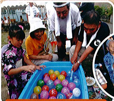
三世代交流納涼会(南本町1丁目)