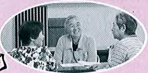
活動についてお話すボランティアさん