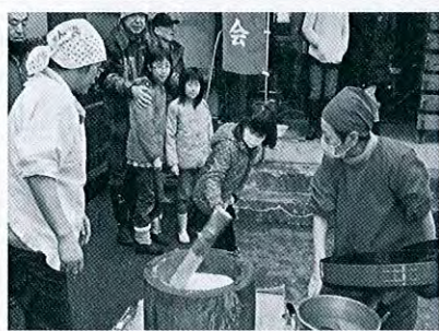
国府3 雪まつり・餅つき