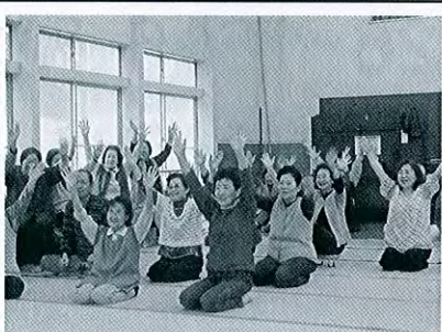
上源入 ふれあい交流会