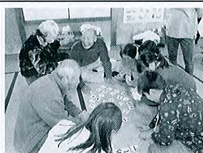
小泉 老人と子どもの集い

これまで皆様に支えて いただきました事業です が、今年度をもって終了 となります。 たくさんのご活用を いただき ありがとう ございました。