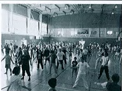
国府2 さわやか秋の集い