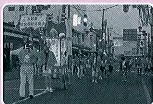
直江津民謡流しにも参加！