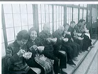
西本町4 御幸町 もちつき大会