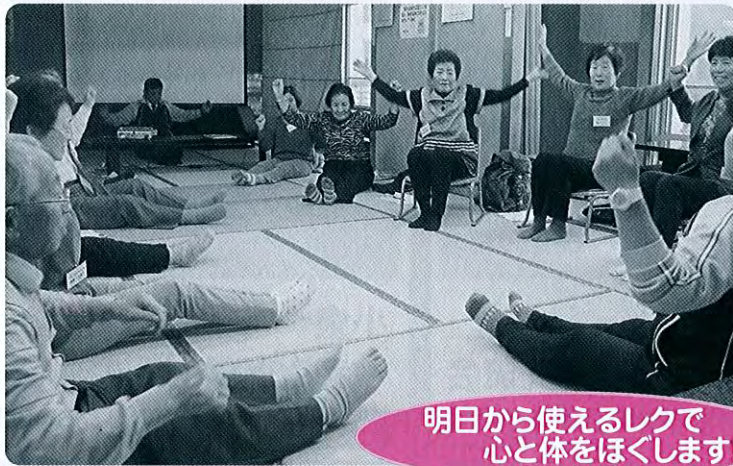
明日から使えるレクで 心と体をほぐします!

11月19日、春日山荘にふれあいいきいきサロン・小地域ネットワーク活動地区の代表者の方からお集まりいただきました。 直江津地域には、それぞれ特色のある集い(サロン)と見守り(ネット)活動を行っている地区が10地区あります。