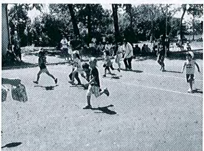
遊光寺浜 ミニ運動会