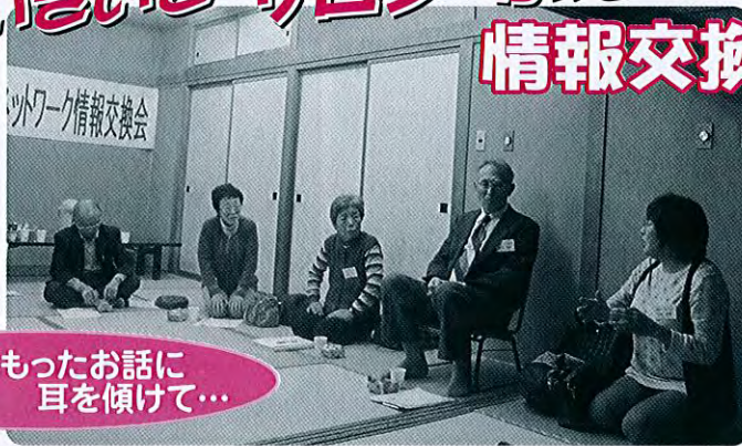
熱意のこもったお話に 耳を傾けて...

11月19日、春日山荘にふれあいいきいきサロン・小地域ネットワーク活動地区の代表者の方からお集まりいただきました。 直江津地域には、それぞれ特色のある集い(サロン)と見守り(ネット)活動を行っている地区が10地区あります。