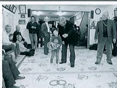
中央4 沖見町 新春町内交流会