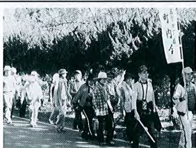
五智4 町内散策の日