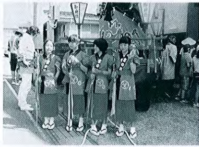
川原町 宮の前屋台