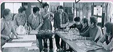
塩浜町お楽しみ会の様子

居場所づくりを進めています。内容の提案、調整、課題発見・検討…等 お手伝いします。