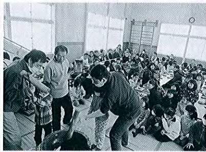
東雲町1,2 もちつき大会