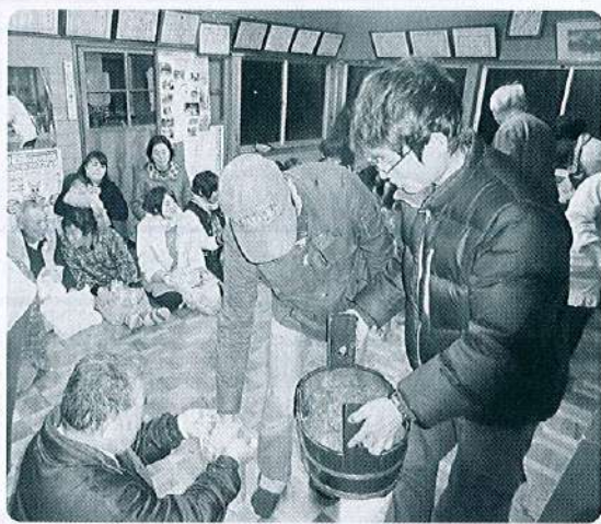
鍋ヶ浦 ぼたもち祭交流会