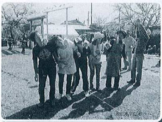
市之町 三世代交流会