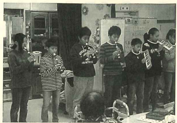
清心荘訪問 宮島小学校:5.6年

11月8日に学校田でとれた新米を持って清心荘に遊びに来てくれました。歌や合奏に、利用者みなさんも大喜びでした。ありがとうございました。