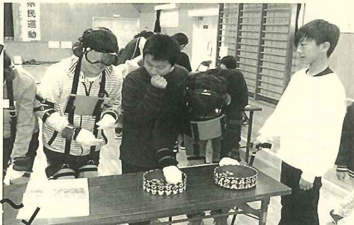
薬を取り出してみよう!! 思うように手先が動かない...