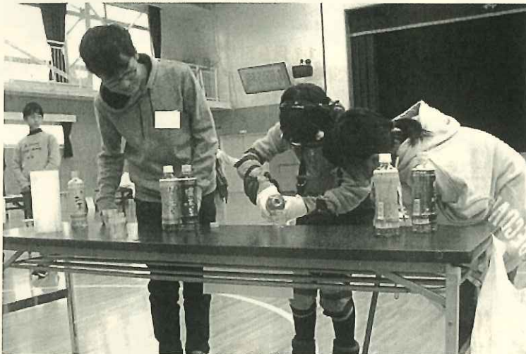
こぼさないように、慎重に水をカップに注ぎます。