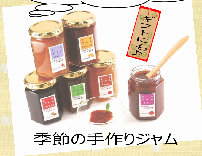
季節の手作りジャム