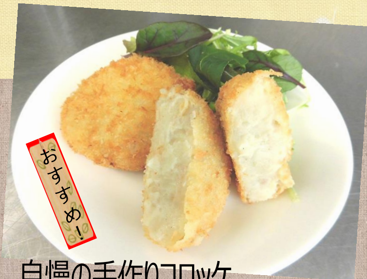
自慢の手作りコロッケ

種類豊富な手作りコロッケ♪ 一つ一つを丁寧に、 心を込めて作ります。 また、お惣菜の製造販売 もおこなっています。 毎週火曜日にお惣菜、 木曜日にコロッケを予約 販売しております。 当事業所渡しの他、配達も承ります。 お気軽にご注文ください!