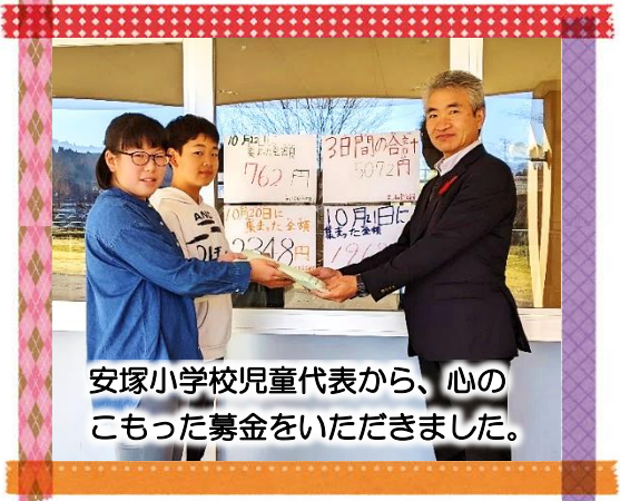
安塚小学校児童代表から、心こもった募金をいただきました。

この募金は、安塚区の地域福祉事業、県内の社会福祉施設や団体の行う福祉活動、災害支援等に活用させていただきます。