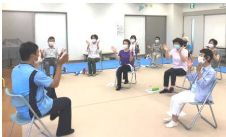
ボランティアセンター