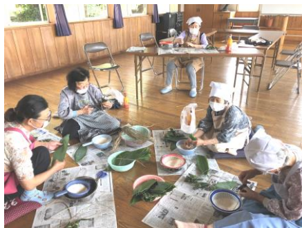
↑長崎サロン・ちまき作り