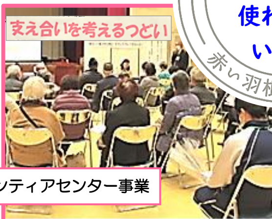
ボランティアセンター事業