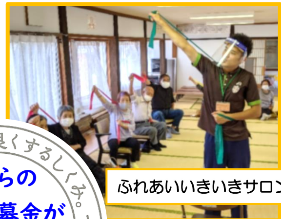
ふれあいいきいきサロン事業