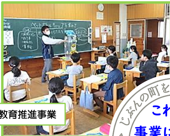
福祉教育推進事業