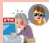
消費生活センター