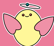
上越市社協マスコット キャラクター「めぐりん」

当たり前と思っていた普段の暮らしが新型コロナウイルス感染症によって変わりました。「誰もが地域で笑顔の暮らしを取り戻せる社会になってほしい」、そんな願いから『シトラスリボンプロジェクト』は生まれました。