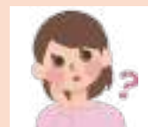
地域包括支援 センター