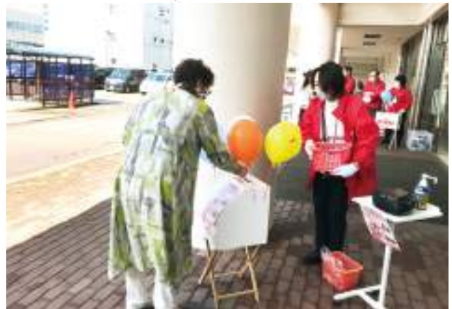
感染予防を徹底しての街頭PR活動（10月1日）