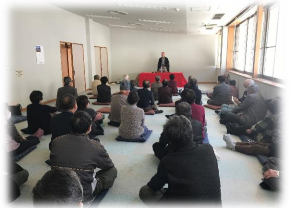
【令和2年度 高齢者ふれあい交流会 三遊亭楽々さんのお話】

※【市内福祉団体事業】には、名立区の福祉団体「名立区住民福祉会」が実施する高齢者ふれあい交流会の事業費の一部が含まれています。