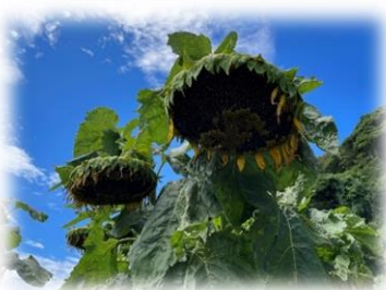
直径 25cmの大輪の花が咲きました！

名立区住民福祉会と社会福祉協議会名立支所と共同で、「つくしひまわり」にっこりプロジェクト」に参加し、約9kgの種が採れ、先日、つくし工房（障がいをお持ちの方が一般就労に向けて必要な技術や知識を習得する施設）にお届けしました。こうして集められた種はつくし工房でひまわりオイルになり、お菓子の製造や食用油として活用されます。 ご協力ありがとうございました。