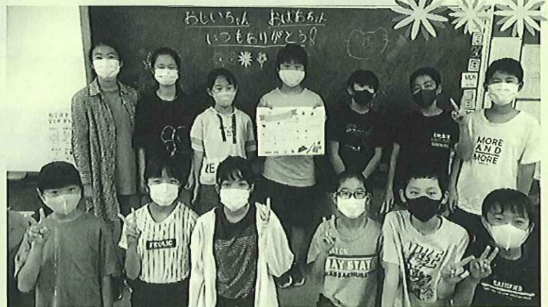
75歳未満の皆様へも、感謝の気持ちを伝えています