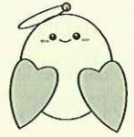
社協マスコットキャラクターぬくりん

上越市社会福祉協議会 大島支所 上越市大島区岡 3388-1 (大島地区公民館内) 電話 594-7107 不在時は 599-3878