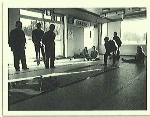
ふれあいいきいきサロン