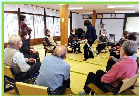
〈安塚にここにサロンの様子〉