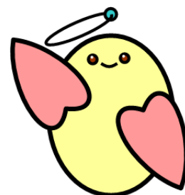
社協マスコット・めくいん