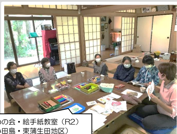
すずめの会・絵手紙教室 (R2) (小田島・東蒲生田地区)