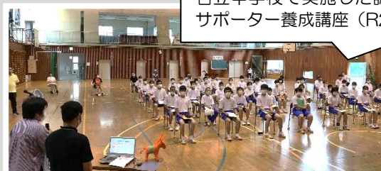
名立中学校で実施した認知症サポーター養成講座 (R2)

・あらゆる世代を対象に、福祉への関心を高め、自主的に取り組む福祉活動を推進する人材の育成につなげていきます。