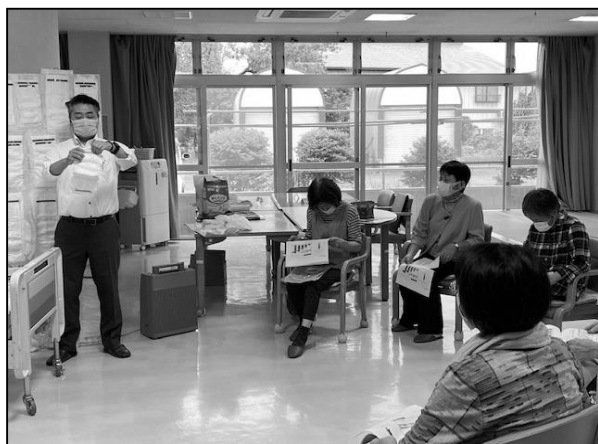
10/5 家庭介護教室【オムツについて教えてください】