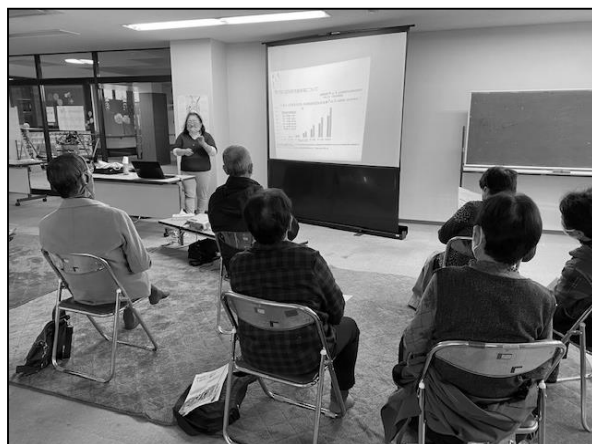
11/2 県立看護大学原准教授による認知症という病気についてもっと知りたい(中級編)