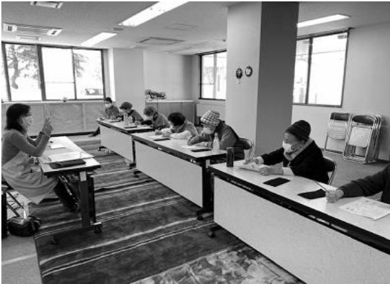
【歯科衛生士による口腔ケア】