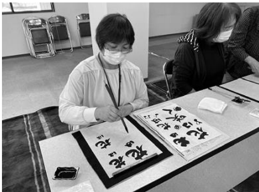
【久しぶりに習字をしてみました。】