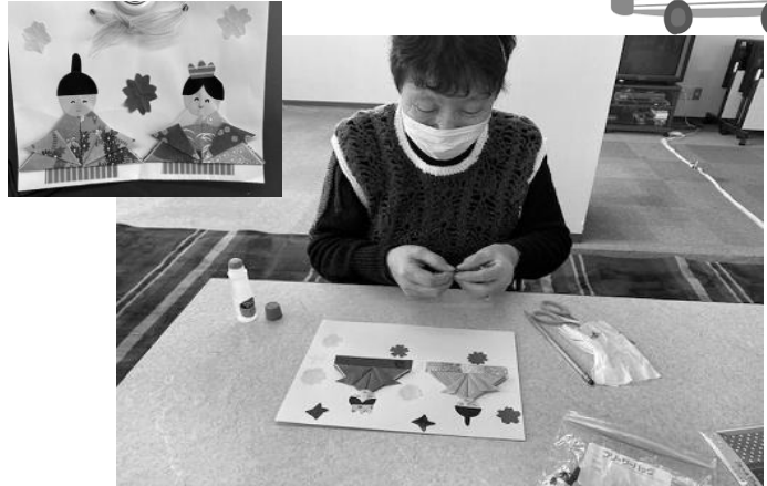
【支援員さんと一緒にお雛様づくり】