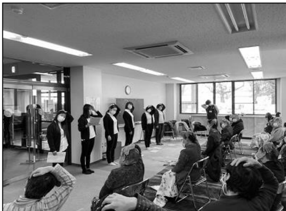
【県立看護大学学生による認知症予防体操】