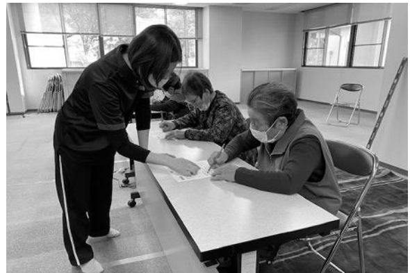
【作業療法士による介護予防】