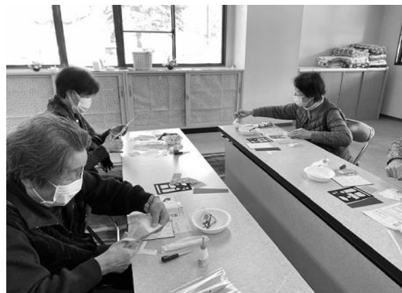
【手芸キットを使ってお雛様づくり】