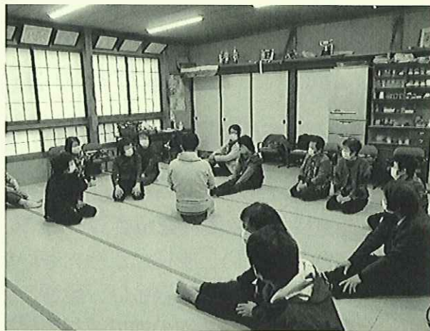
11/26 仁上センターの様子