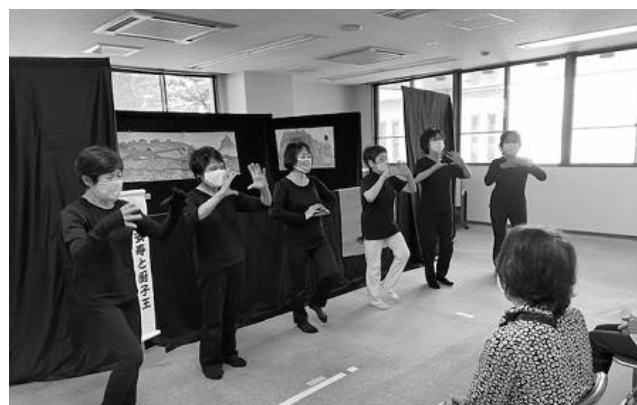
【手話による「小さな世界」】