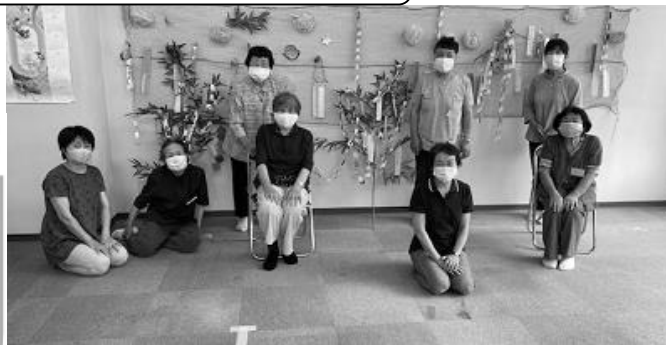
【今年度初めての活動は七夕かざりをつくりました。】