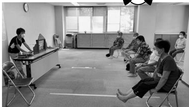
【みなさん大好きな紙芝居聞き入っています。】