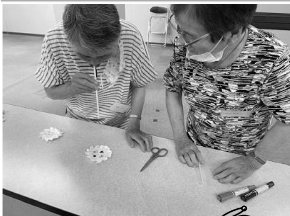
【息をふきかけるとまわるコマ！ うまくできました。】