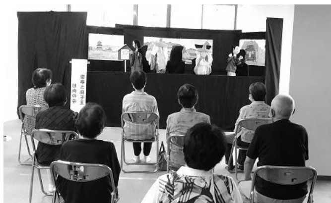
【日向の会さんより人形劇の発表】