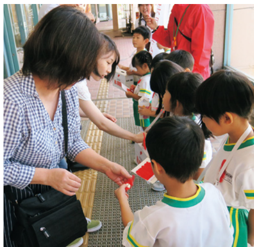
イオン上越店様・アコーレ様でのPR募金運動