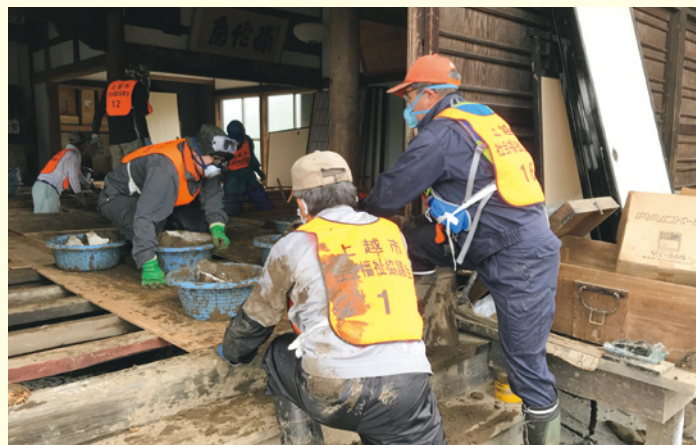
災害時の支援活動

●地域住民の居場所づくりの活動に 地域での孤立や閉じこもりの予防、介護予防や健康増進などを目的に「地域の方々が集える居場所づくり」の活動が広がっています。最近では「子育てサロン」や「男性のサロン」など様々な「地域の居場所」が増えています。