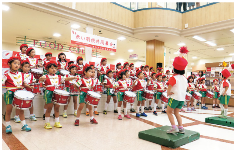
オープニングセレモニーでの鼓笛演奏