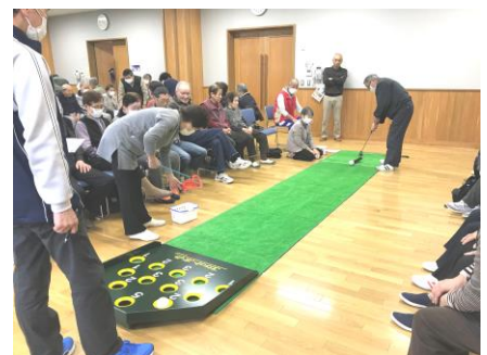
【スカットボール大会】