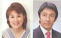
プレミアムトーク 山田邦子さん (タレント) 朝原宣治さん (北京五輪銀メダリスト)