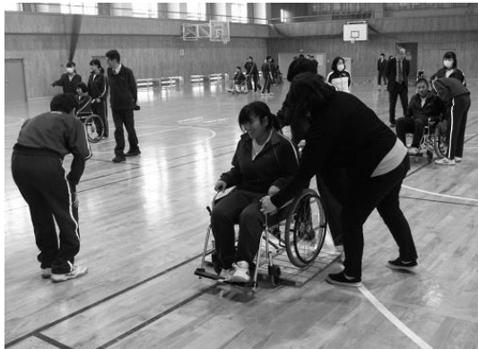
【介護についての講演と車椅子体験】新潟県介護福祉士会の先生より車椅子の操作方法を学びました。(板倉中学校3年生)