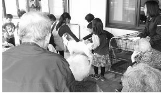
【清心荘訪問】かわいい子どもたちがクイズと合唱を披露してくれました。やぎのきらりの訪問もあり気持ちがいやされました。(豊原小学校 1年生)