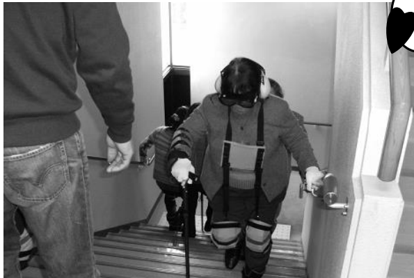
民生委員児童委員協議会の定例会で子供たちの活動を知ってもらい、民生委員の皆さんも高齢者疑似体験を行いました。