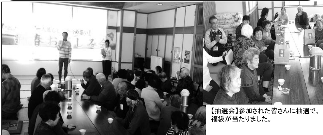
【抽選会】参加された皆さんに抽選で、福袋が当たりました。