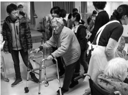
【清心荘訪問】自分達で考えた”できること”の内容を職員からアドバイスをもらい、清心荘で実践してみました。(宮嶋小学校 5・6年生)