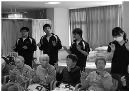
【清心荘訪問とボランティア活動】一生懸命に洗ってくれた網戸はキレイになり、おかげで気持ちよく過ごす事ができます。若い力はレクリエーションでも利用者の元気につながっていきます。(有恒高等学校 1年生・3年生)