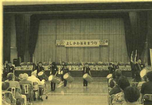
鼓舞衆の皆さんから太鼓の演舞で オープニングを飾っていただきました