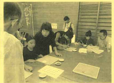
焼き物の文字入れ体験