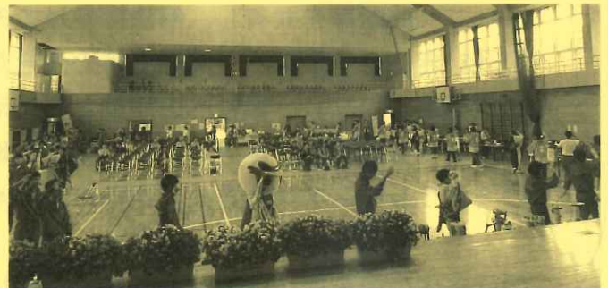
フィナーレは「吉川踊り隊」の皆さんと 会場の皆さんで輪踊りでつながりました