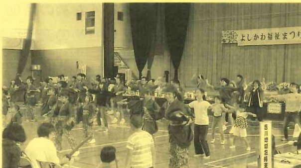
よさこい「百華踊乱よしかわ」の演舞に 会場から飛び入り参加で大にぎわい