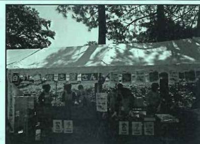
6/3 (日) かっぱ祭り会場にて

第 32 回かっぱ祭りに参加し、恒例の「白いタイヤキ」を販売しました。今年度は「上越看護専門学校」の学生さんにボランティアでお手伝いをいただき、タイヤキも皆様から大変好評でした。ご来場の皆様から沢山購入いただきました。ありがとうございました。