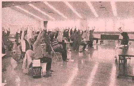
ボランティアの発掘、養成研修