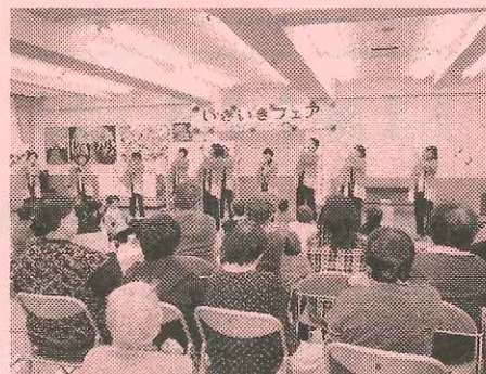
地域の福祉の集い