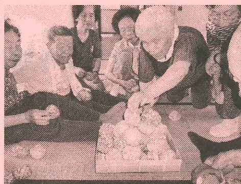
地域のふれあい、交流の場