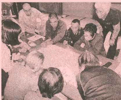
町内の支え合いの様子を確認