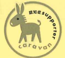
認知症サポーターキャラバン