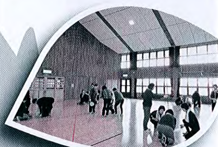
ボランティアセンター事業 (ボランティア研修会)