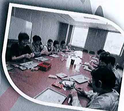
地域支え合い事業 (すこやかサロンの様子)