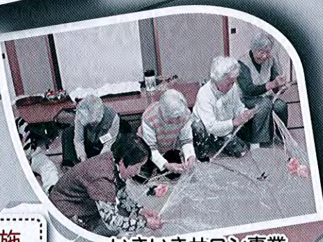
いきいきサロン事業 (やすらぎサロンの様子)