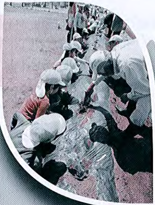
福祉教育推進事業