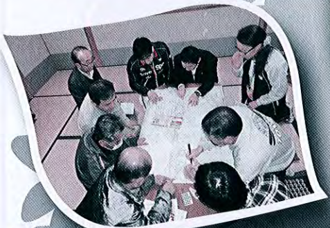
支え合いマップ作り事業