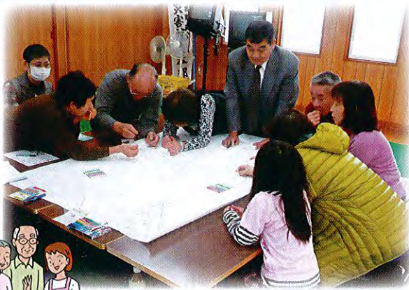
松橋町内会の作成風景