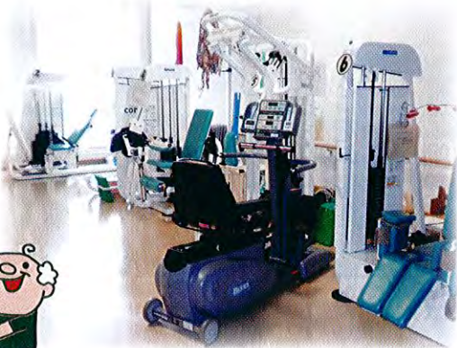
器械7台設置してあります