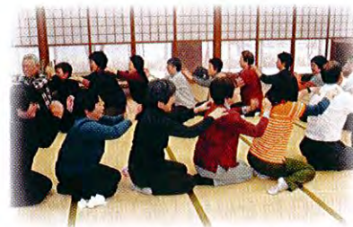
H26.3.20 開催の運動遊びを通じた研修会の様子

地域でボランティア活動をしている方や、興味や関心をお持ちの皆さんを対象に研修会を行います。