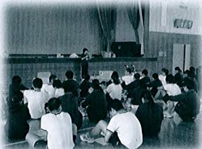
柿崎中学校 福祉教育