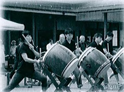
福祉まつり 鼓友会様