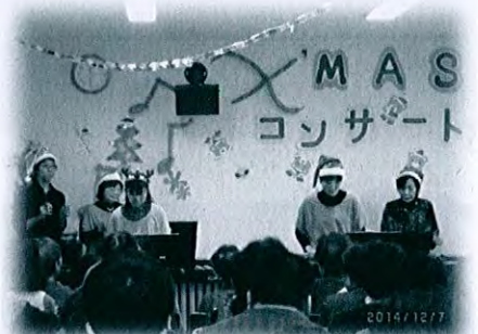
クリスマスコンサート (今年度は12月6日開催予定)