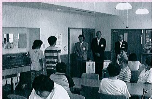
信越郵便局長協会上越地区様から液晶テレビ等の寄贈 (8/27 ふれんどり～ミルはまなすでの贈呈式)