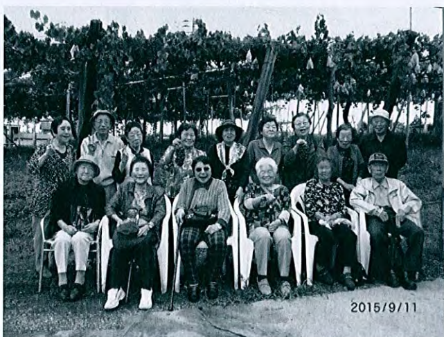
ぶどう狩りへ出かけました

上越市が実施する「地域支え合い事業」を柿崎まちづくり振興会からの再委託で、閉じこもり予防や心身の健康保持、仲間づくり、生きがいづくりなどを目的とした「すこやかサロン」「介護予防教室」を65歳以上の方を対象に開催しています。