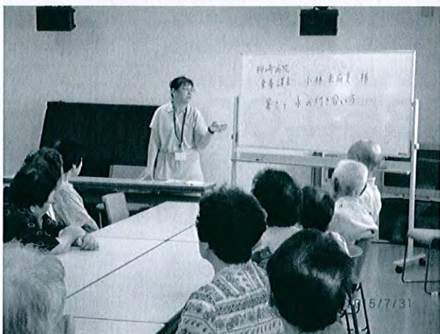
栄養士による介護予防教室

住所：〒949-3216 上越市柿崎区柿崎558番地1 TEL.025-536-6718 FAX.025-536-6510