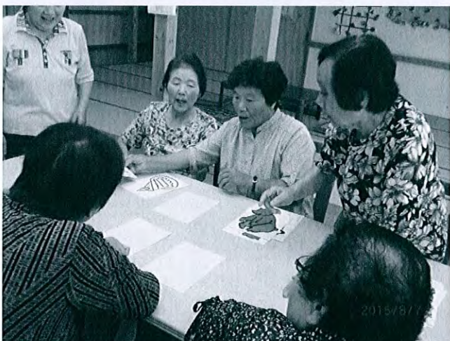
認知症予防に頭の体操